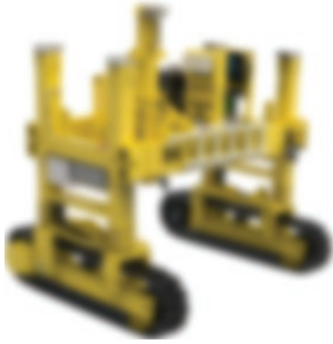
CHARLIE (em breve)